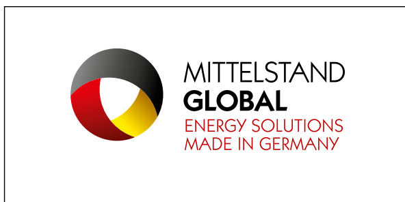
Bildwort-Dachmarke (mit Schutzzone) Farbversion