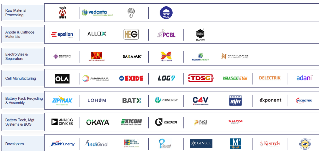
Abbildung 7: Führende Unternehmen entlang der Batteriespeicher-Wertschöpfungskette in Indien

Amara Raja Energy & Mobility ist ein weiterer bedeutender Anbieter, der PLI-Anreize der Regierung nutzt, um Gigafactories und integrierte BESS-Angebote aufzubauen. Die Jakson Group gehört ebenfalls zu den relevanten Marktteilnehmern und bietet mit dem „EnerPack“-System eine modulare Lithium-Ionen-Batteriespeicherlösung (BESS) für vielfältige Anwendungen an. Oriana Power schließlich hat ihre Fähigkeit zur Umsetzung groß angelegter Projekte mit einem 250-MW/500-MWh-BESS-Auftrag der GUVNL unter Beweis gestellt – ein deutliches Signal für das hohe Marktpotenzial.