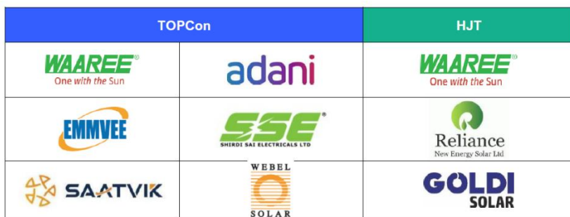
Abbildung 4: Technologien von PV-Modulen, nach Herstellern

Die nachstehende Abbildung zeigt die von indischen OEMs bevorzugten PV-Modultechnologien. 22 Die in der Abbildung dargestellten Hersteller – darunter Waaree, Adani, Emmvee, Shirdi Sai Electricals, Reliance, Saatvik, Webel Solar und Goldi Solar – zeigen, dass indische OEMs sowohl auf TOPCon als auch auf HJT setzen, teilweise parallel, um Flexibilität und künftige Marktchancen zu maximieren. Deutsche Unternehmen mit Know-how in modularen, aufrüstbaren Fertigungslinien, die den Übergang von Mono-PERC auf TOPCon oder HJT ermöglichen, sind hervorragend positioniert, um indische Hersteller bei der zukunftssicheren Ausrichtung ihrer Produktionskapazitäten zu unterstützen.