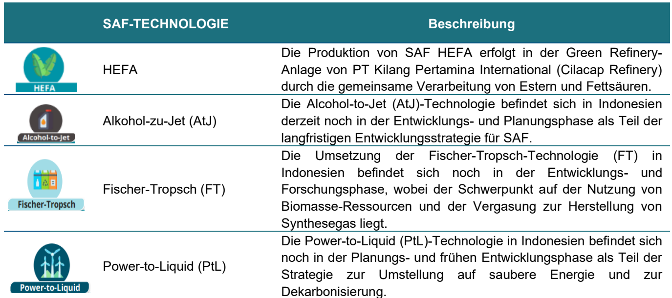
Tabelle 2: Produktionstechnologien für nachhaltigen Flugkraftstoff

Quelle: Eigene Darstellung nach (Koordinierungsministerium für maritime Angelegenheiten und Investitionen, 2024)