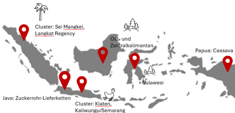
Abbildung 3: Wichtige Standorte und Rohstoffquellen für Bioenergie in Indonesien

Eine Übersicht über die wichtigsten Standorte und Rohstoffquellen liefert die folgende Abbildung: