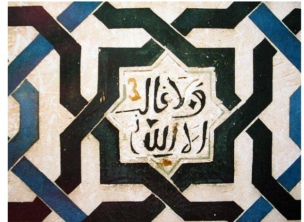
Wandfliese Gerichtssaal Alhambra"