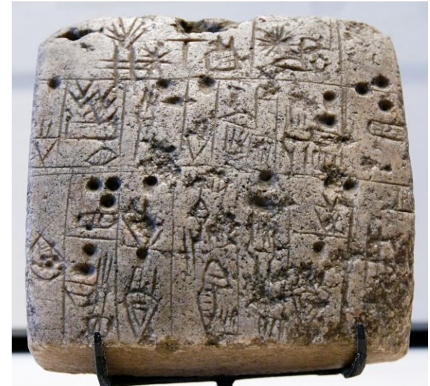
Sales contract Louvre AO2753“ von Marie-Lan Nguyen / Wikimedia Commons.