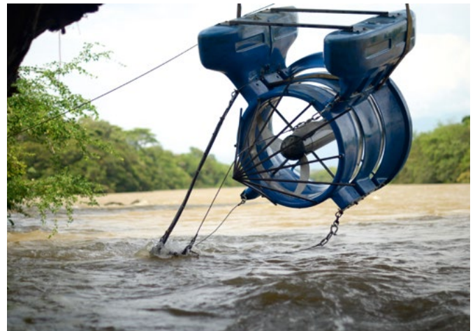
Im dena-RES-Programm können Projekte mit unterschiedlichen Erneuerbare-Energien-Technologien umgesetzt werden: In Kolumbien betreibt eine Hybrid-Anlage, bestehend aus einer hydrokinetischen Turbine und PV-Modulen, örtliche Bewässerungspumpen.

Ihr Unternehmen hat seinen Firmensitz in Deutschland und Sie planen die Erschließung eines neuen Marktes für Ihre Produkte? Eine Projektidee aus den Bereichen Solarenergie, Wind- oder Wasserkraft, Bioenergie, Geothermie oder eine Hybridlösung haben Sie schon im Kopf, eventuell auch in Kombination mit Energieeffizienz-Maßnahmen oder Speichertechnologie? Jetzt wünschen Sie sich Beratung, tatkräftige Hilfe bei der Netzwerkarbeit und eine finanzielle Unterstützung, die Ihr Risiko minimiert? Dann ist die Teilnahme am dena-RES-Programm der logische nächste Schritt für Sie.