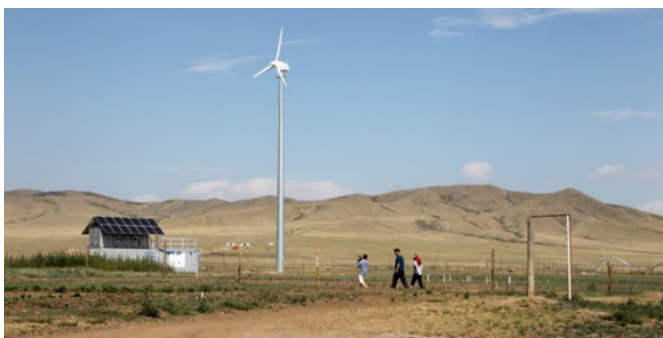
Im Rahmen des dena-RES-Programms wurde in einem netzfernen Gebiet in der Mongolei ein Hybrid-System errichtet. Dieses besteht aus einer Kleinwind-Anlage, einer PV-Anlage, einem Notstromaggregat sowie einem Batteriesystem als Pufferspeicher.

Das dena-Renewable-Energy-Solutions-Programm (kurz: dena-RES-Programm) wurde von der Deutschen Energie-Agentur (dena) ins Leben gerufen, um deutschen Unternehmen der Erneuerbare-Energien-Branche bei dem Export ihrer Produkte maßgeschneiderte Unterstützung zu bieten. Gefördert wird es vom Bundesministerium für Wirtschaft und Energie (BMWi) im Rahmen der Exportinitiative Energie.